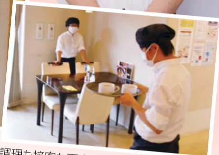
調理も接客も丁寧な仕事を心がけています