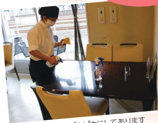
テーブルはいつもピカピカにしております