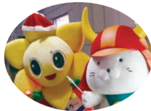
開会式に「にしまろちゃん」と「ひこにゃん」が登場します