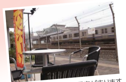
テラス席では目の前を電車が走ります