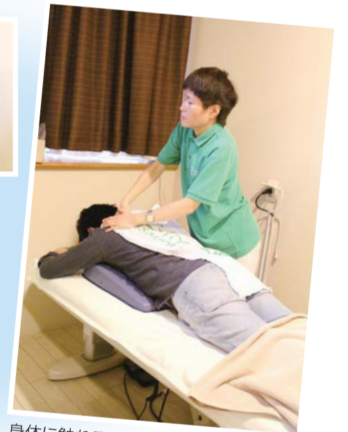
身体に触れることで色々なことが分かります