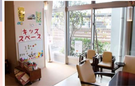
子どもを遊ばせながら、安心して食事を楽しめます