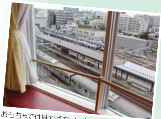
おもちゃでは味わえない大迫力の電車の並走が広がります