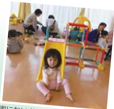
家におもちゃで子どもの運動量が増えてよいそうです