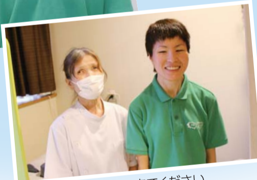
ぜひ、リフレッシュしに来てください

おすすめは40分1,500円のコース。肩、背中、腰などの他に、お客様の要望や身体の状態に合わせた施術も行います。