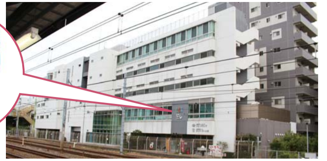
どうやって入るの?と思った人も多いとか。入り方は7ページで。